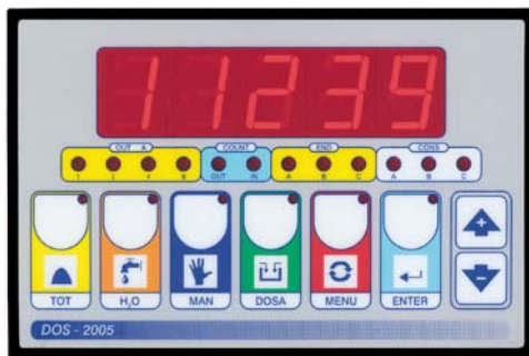
Bilancia "A" (Scale "A")