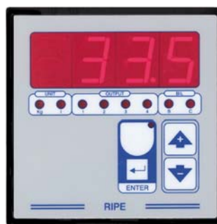
Bilancia "B" (Scale "B")